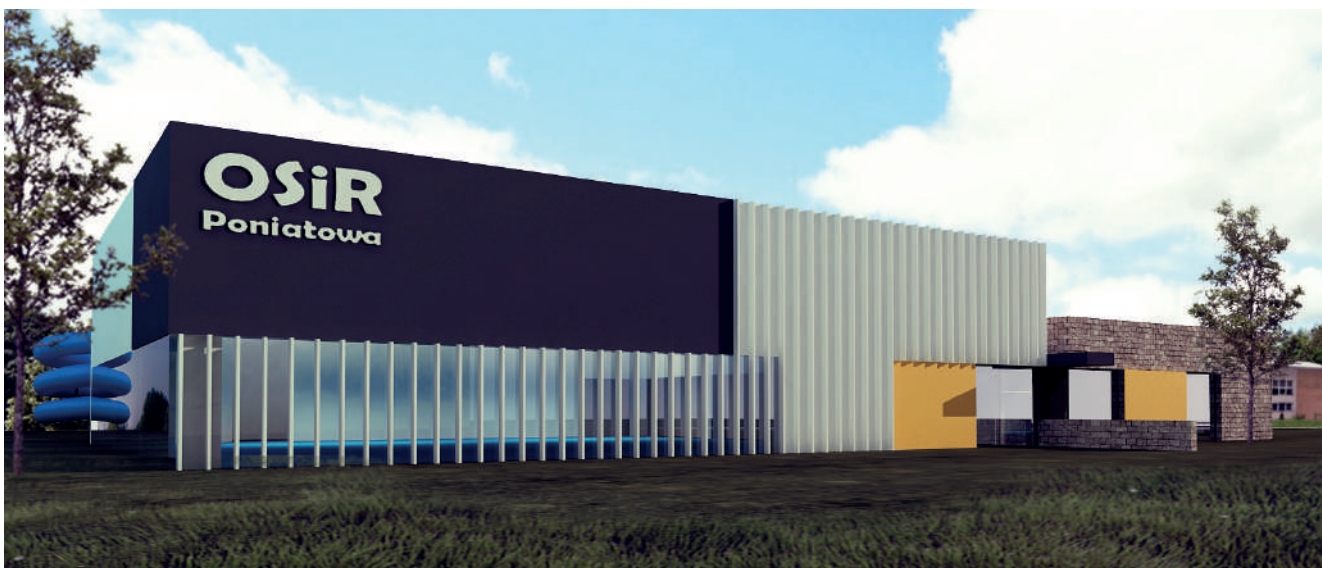
Wizualizacja przedstawiająca budynek OSiR w Poniatowej

Programu „Sportowa Polska - Program Rozwoju Lokalnej Infrastruktury Sportowej” – Edycja 2021.