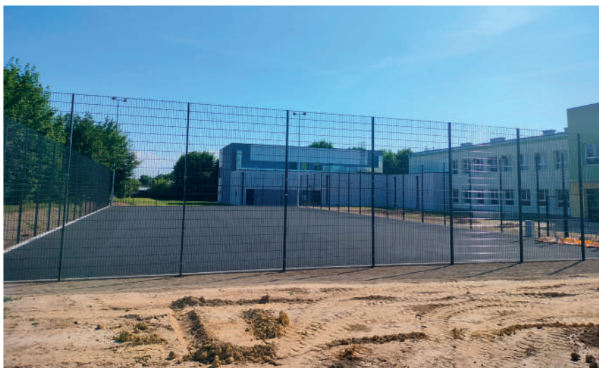
Boisko przy szkole podstawowej w Niezabitowie

W czerwcu zakończyliśmy budowę boiska przy ul. 11 Listopada w Poniatowej. W ramach zadania inwestycyjnego pn.: „Przebudowa boiska piłkarskiego w Poniatowej przy ul. 11 Listopada” powstało nowoczesne boisko do gry o nawierzchni z trawy sztucznej z bramkami, oświetleniem, odwadniającym systemem drenażowym oraz kabinami dla zawodników. Teren wokół boiska został ogrodzony i zagospodarowany. Inwestycja jest współfinansowana ze środków Funduszu Rozwoju Kultury Fizycznej w ramach