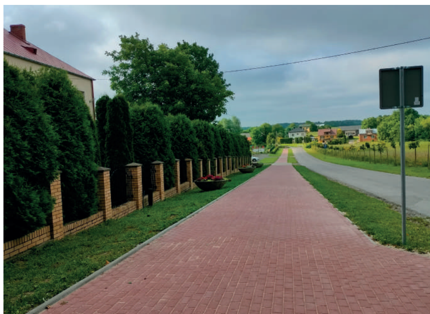
Chodnik w Kraczewicach Prywatnych

Inwestycje możliwe są dzięki dofinansowaniu, jakie Gmina Poniatowa pozyskała z Rządowego Funduszu Polski Ład: Program Inwestycji Strategicznych oraz „Realizacja lokalnych strategii rozwoju kierowanych przez społeczność” Priorytet 4 „Zwiększenie zatrudnienia i spójności terytorialnej”, objętego Programem Operacyjnym „Rybnictwo i Morze”, z wyłączeniem projektów grantowych.