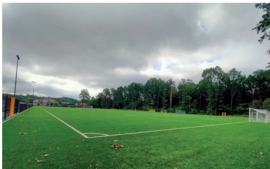
Boisko przy ul. 11 Listopada w Poniatowej